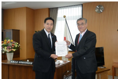
政府案を取りまとめる山際大志郎経済財政担当大臣