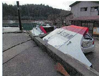
地震で防火塀が倒れた穴水町のSS

中には7日間にわたって停電が続いたため、住民拠点SSでは配備された緊急用自家発電設備を使って給油を続けたが、自家発がないSSでは燃料を求める消費者のために、計量機を手回しながら燃料を汲み上げたSSスタッフもいました。また「家が住めなくなったのでタンクローリーで車中泊していたが、寒波・降雪で身の危険を感じている」など、厳しい環境の中で石油製品の供給に従事しています。