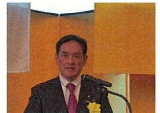
岩田和親経済産業副大臣