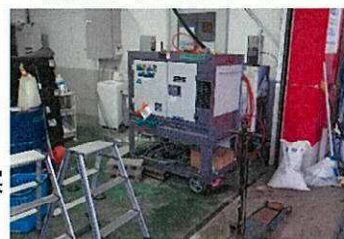
輪島市のSSで活躍した自家発電機