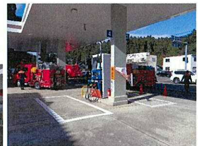
緊急車両に燃料供給を続けた穴水町の中核SS