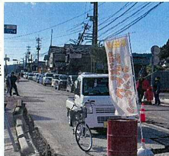
給油待ちの車で渋滞が発生した珠洲市のSS