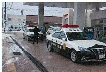
緊急車両に給油を行う珠洲市のSS