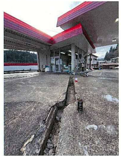
フィールドに亀裂が走った穴水町のSS