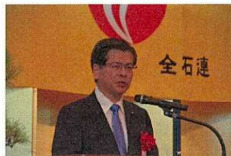
公明党の石井幹事長