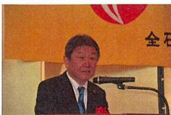
自民党の茂木幹事長

全石連・全国石油協会が1月12日に開催した新年賀詞交換会に、所管省である経済産業省の岩田和親副大臣をはじめ、自民党石油流通問題議員連盟の田中和徳会長代行と議連メンバーの主要議員ほか、茂木敏充自民党幹事長と石井啓一公明党幹事長が揃って出席し、祝辞と能登半島地震での地元SSの尽力に謝意を述べました。与党の両幹事長の出席は初めてです。