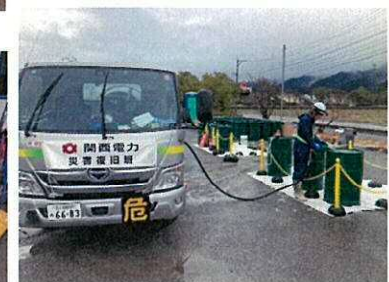
救援の電力会社の電源車に軽油を配送